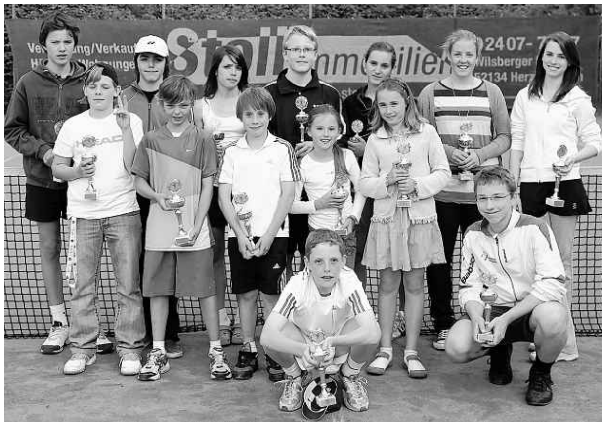
Strahlende Gesichter: Die Kreismeister der Tennis-Jugend freuen sich über ihre Erfolge.